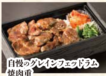
自慢のグレインフェッドラム 焼肉重