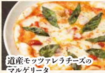
道産モッツアレラチーズの マルゲリータ