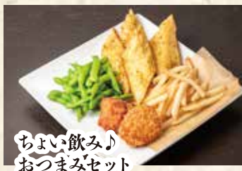
ちょい飲み♪ おつまみセット