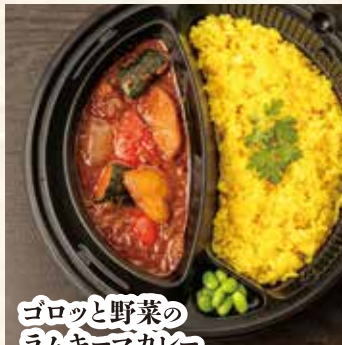
ゴロツと野菜の ラムキーマカレー