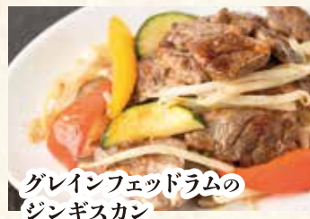
グレインフェッドラムの ジンギスカン