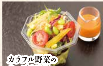
カラフル野菜の カップサラダ