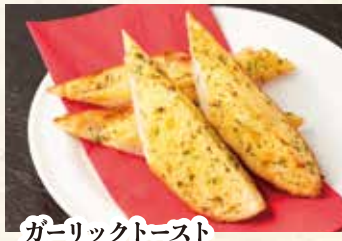
ガーリックトースト