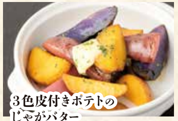
3色皮付きポテトの じゃがバター