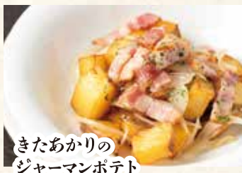
きたあかりの ジャーマンポテト