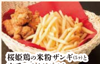
桜姫鶏の米粉ザンギ(5分)と 定番フライドポテト