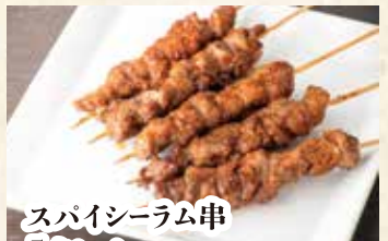
スパイシーラム串 5本セット