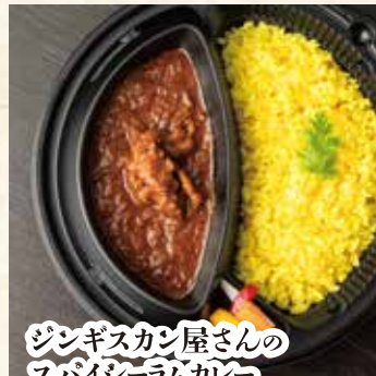
ジンギスカン屋さんの スパイシーラムカレー