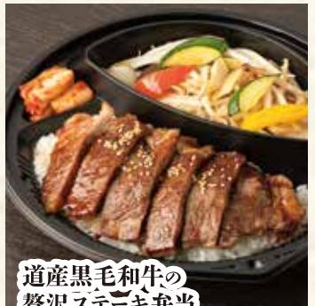
道産黒毛和牛の 贅沢ステーキ弁当