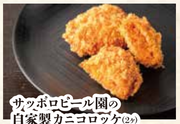
サッポロビール園の 自家製カニコロッケ(2分)