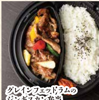
グレインフェッドラムの ジンギスカン弁当