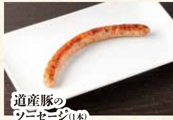
道産豚の ソーセージ(1本)