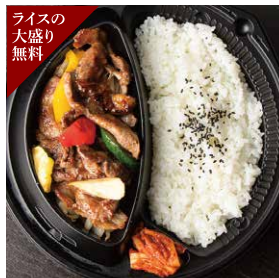
ライスの大盛り無料 グレイنفエッドラムのジンギスカン弁当 1,300円