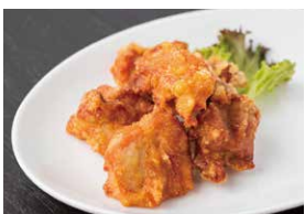
桜姫鶏の米粉ザンギ(5個入り) 800円