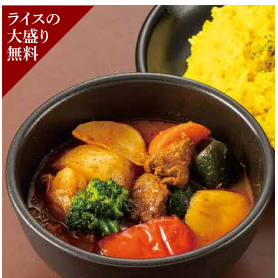
ライスの大盛り無料 グレイنفエッドラムとゴロッと野菜のスープカレー ライス付き 1,680円 カレー単品 1,480円