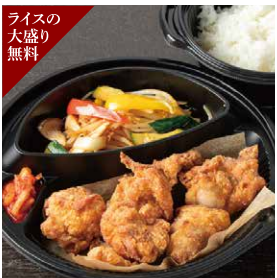
ライスの大盛り無料 ガーデン Grill の特製ザンギと野菜炒め弁当 1,350円