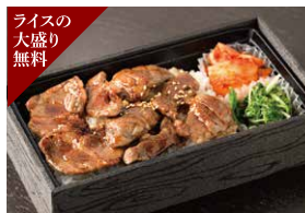
ライスの大盛り無料 自慢のグレイنفエッドラム焼肉重 1,300円