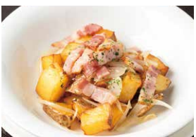
きたあかりのジャーマンポテト 700円