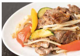
グレイنفエッドラムのジンギスカン 1,100円