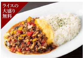
ライスの大盛り無料 ジンギスカン屋さんのガバオライス 980円