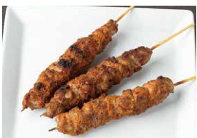
スパイシーラム串 3本セット 1,200円 1本 430円