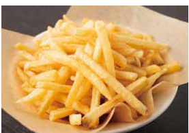
定番フライドポテト 480円