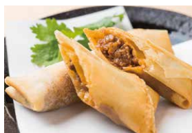
ラムカレーとカマンベールチーズの春巻き(2本) 580円