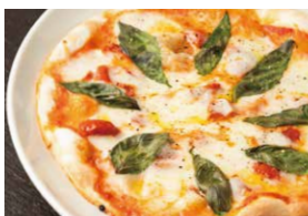
道産モッツァレラチーズのマルゲリータ 1,650円