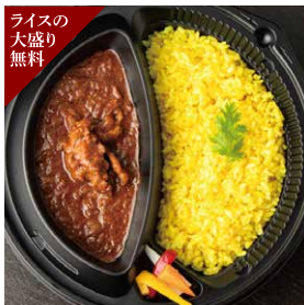
ライスの大盛り無料 ジンギスカン屋さんのスパイシーラムカレー ライス付き 1,480円 カレー単品 1,280円