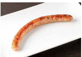
道産豚のソーセージ(1本) 350円