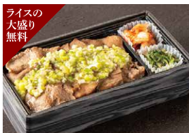
ライスの大盛り無料 ゴマ油香るネギ塩牛タン弁当 1,680円