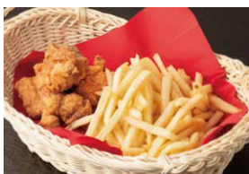
桜姫鶏の米粉ザンギ(5個)と定番フライドポテト 1,150円