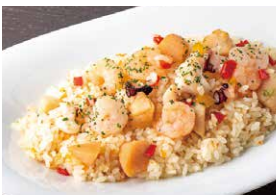
海鮮たっぷりシーフードピラフ 1,450円