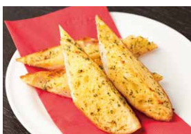
ガーリックトースト 400円