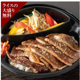
ライスの大盛り無料 道産牛「あまにの恵み」の贅沢ステーキ弁当 2,500円