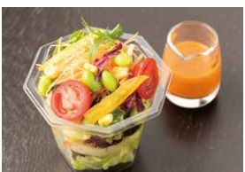
カラフル野菜のカップサラダ 400円