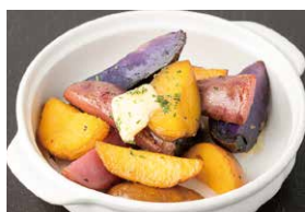
3色皮付きポテトのじゃがバター 550円