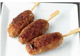
ラムの旨辛醤油つくね 3本セット 1,250円 1本 450円